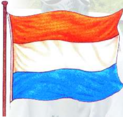
Die Nederlandse vlag

Hierdie vlag met sy drie horisontale bane in rooi (soms oranje), wit en blou het in die jaar 1652, toe Nederland 'n kolonie aan die Kaap gevestig het, oor die Nederlandse Republiek gewapper. Die Verenigde Oos-Indiese Kompanjie (VOC), 'n handelsmaatskappy wat namens Nederland die Kaapse nedersetting begin het, het dieselfde vlag gebruik met die letters VOC op die wit baan in die middel. Die Nederlandse vlag is die langste van al ons kultuurvlae bo die Afrikanergemeenskap gehys, naamlik van 1652 tot 1795 en toe weer van 1803 tot 1806, toe Brittanje die Kaap beset en die Britse Union Jack die Nederlandse vlag verdring het.