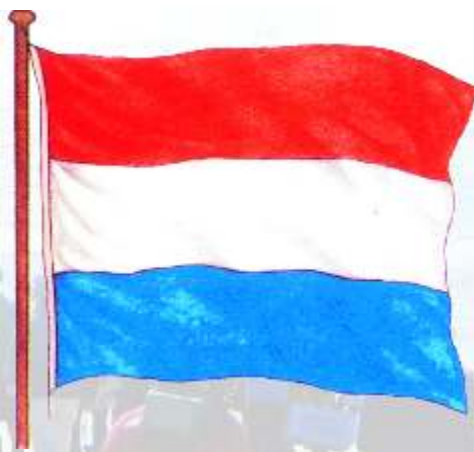
Die Lydenburgse vlag

In die pioniersjare van die ou Transvaal, voordat die ou Voortrekkers en hulle afstammeling 'n sterk staat gevorm het, het die inwoners van Lydenburg van 1857 tot 1860 hulle eie vlag gebruik. Dit het soos die Nederlandse vlag gelyk, maar met 'n rooi baan bo.