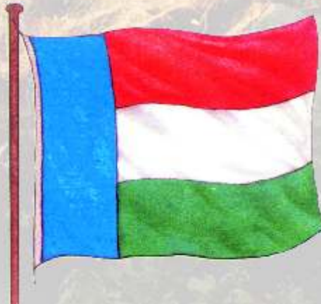
Die Vierkleur (vlag van die ZAR)