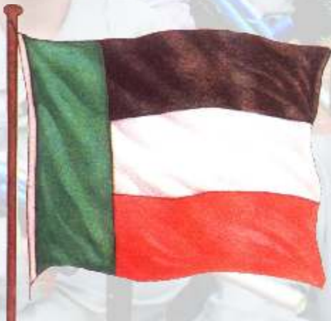
Die vlag van Land Goosen

Hierdie was die tweelingrepubliek van Stellaland. Dit was direk noord daarvan geleë met Rooigrond, wat naby die huidige dorp Mafikeng geleë is, as hoofsentrum. Dit het ook van 1882 tot 1884 bestaan en is uiteindelik op dieselfde wyse as Stellaland verdeel. Die Gooseniete het 'n vierkleur gehad met swart, wit en rooi horisontale bane en 'n vertikale groen baan teen die vlagpaal.