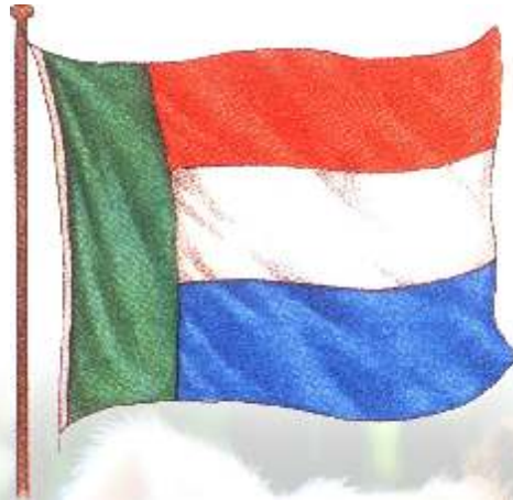
Vlag van die Nuwe Republiek

Ons negende kultuurvlag is die vlag van die Nuwe Republiek, wat van 1884 tot 1888 suid van die suidoos-grens van die Zuid-Afrikaansche Republiek (Transvaal) bestaan het. Die hoofstad van daardie republiek was Vryheid. Dit is in 1888 by Transvaal ingelyf as die distrik Vryheid maar het na die Anglo-Boereoorlog deel van Natal geword. Die vlag van die Nuwe Republiek het soos die Vierkleur gelyk maar met 'n blou vertikale baan teen die vlagpaal en rooi, wit en groen bane horisontaal onder mekaar.