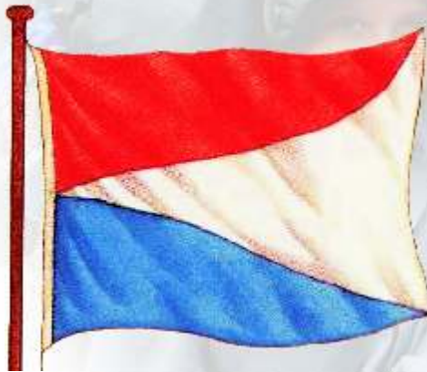
Die vlag van die Republiek van Natalia

Hierdie vlag is in 1839, toe die Republiek van Natalia deur die Voortrekkers onder leiding van Andries Pretorius gestig is, in gebruik geneem. Die Republiek van Natalia het tot in 1845 bestaan, toe daardie gebied deur Brittanje geannekseer is. Hierdie rooi, wit en blou vlag met sy driehoekpatrone is aan ons almal goed bekend, omdat dit van 1931 af as amptelike vlag deur die Voortrekkers gebruik word.