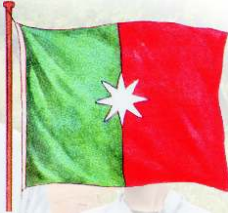
Die Stellalandse vlag

Die Republiek Stelleland het net enkele jare bestaan, naamlik van 1882 tot 1884. Dit was op die Transvaalse wesgrens geleë en die hoofstad daarvan was Vryburg. Die oostelike deel van Stellaland het in 1884 deel van die Zuid-Afrikaansche Republiek geword en die westelike deel 'n deel van Brits-Betsjoeanaland, wat later by die Kaapprovinsie ingelyf is. Die Stellalandse vlag het twee vertikale bane, groen links teen die vlagpaal en rooi regs, met in die middel tussen die twee bane 'n wit ster.