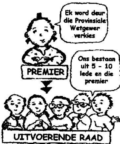
Provinsiale Uitvoerende Gesag